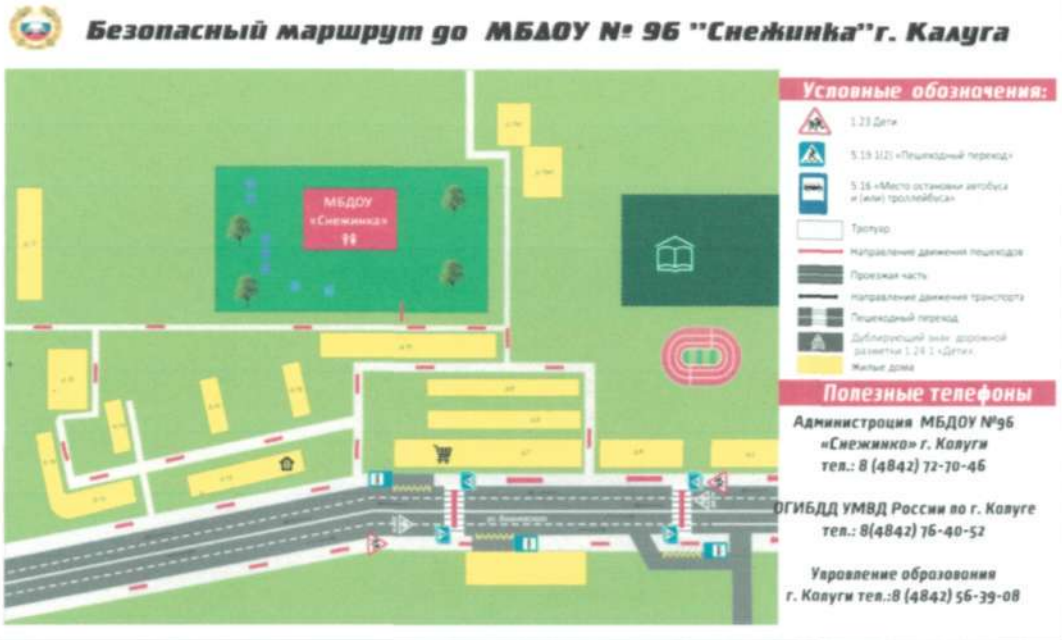
Пути движения транспортных средств к местам разгрузки/погрузки и рекомендуемые пути передвижения детей по территории МБДОУ № 96 «Снежинка»