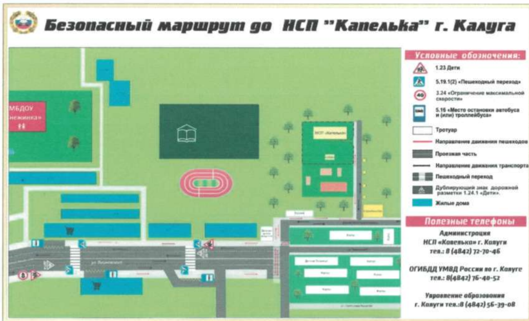
Схема движения транспортных средств к месту погрузки/разгрузки