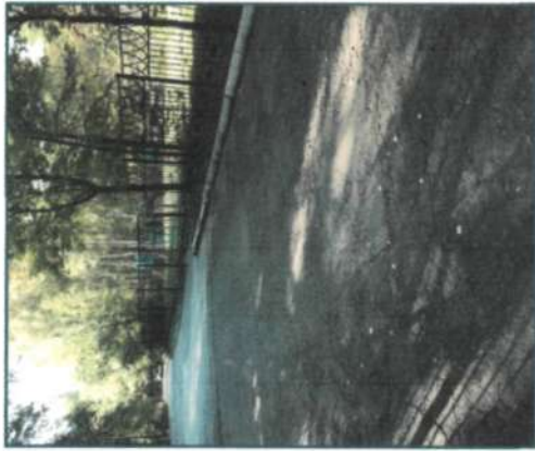
Фото подхода к образовательной организации