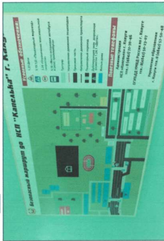
Фото на странице: 3